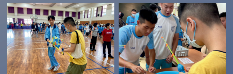
有時候靜默更能傳遞關懷，更能傾聽他人，關心他人。